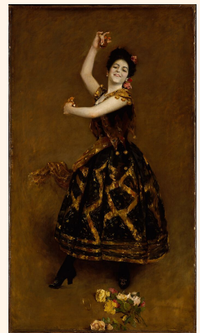
Título: Carmencita Artista: William Merritt Chase, (1890) Lugar: Museo Metropolitano de Arte, Nueva York Licencia: dominio público

Para ediciones pasadas visite: https://bit.ly/ArtsAllAroundUs