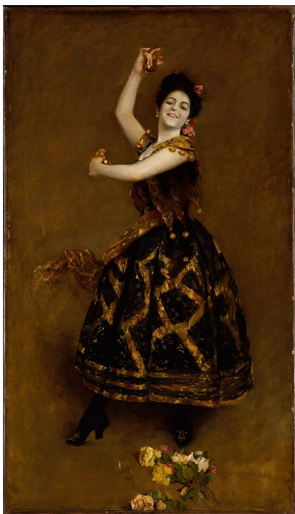
Título: Carmencita Artista: William Merritt Chase, (1890) Lugar: Museo Metropolitano de Arte, Nueva York Licencia: dominio público

Para más información contacte a: Kate Stover - kate.stover@tcoe.org